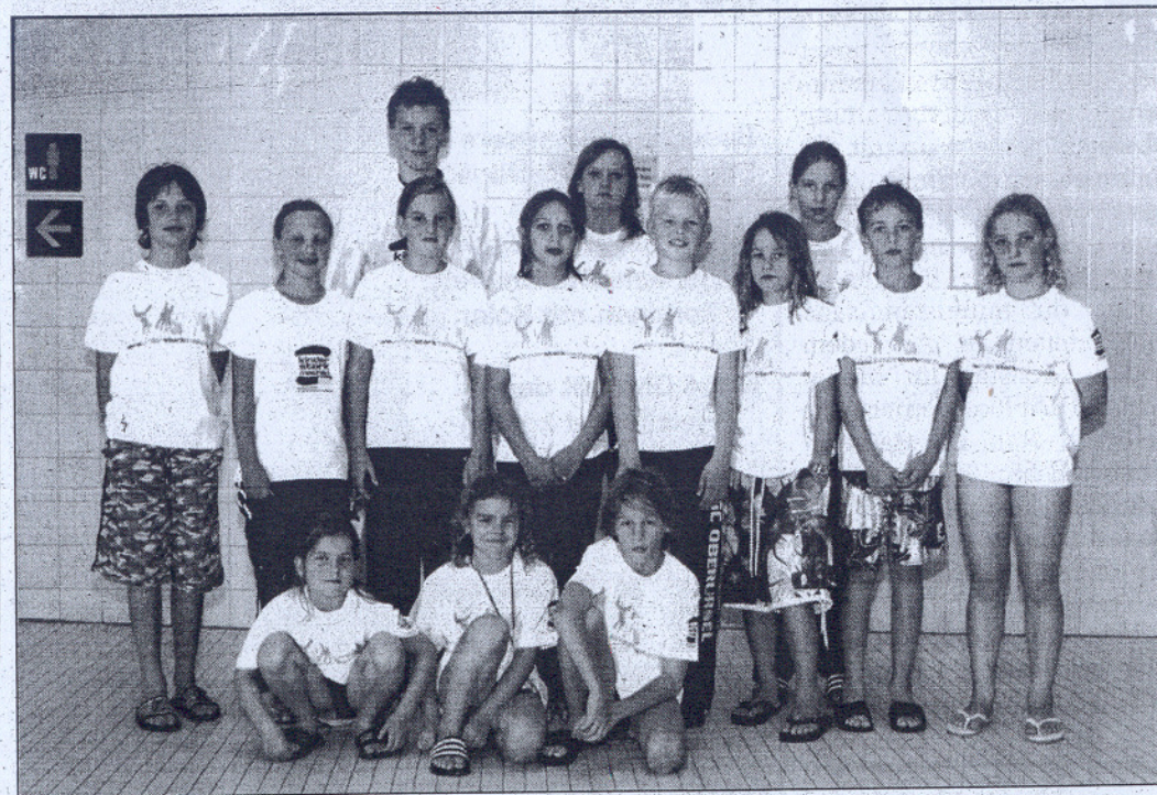
Eine Auswahl aus den Jugendmannschaften des Schwimmclubs Oberursel, präsentierte die T-Shirts mit dem Slogan „Kinder stark machen“. Der SCO beteiligte sich dieses Jahr erstmals an der Kampagne der Bundeszentrale für gesundheitliche Aufklärung.